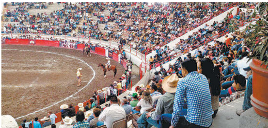
Mañana, lo mejor en el Constitución (arriba); la Nacional de manteles largos (abajo)