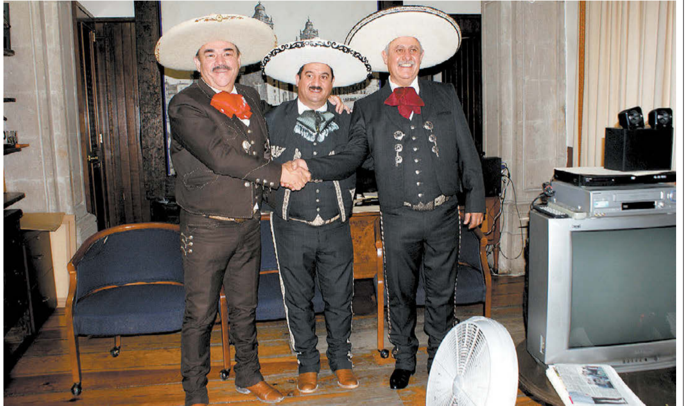
El pacto está vigente y debe cumplirse