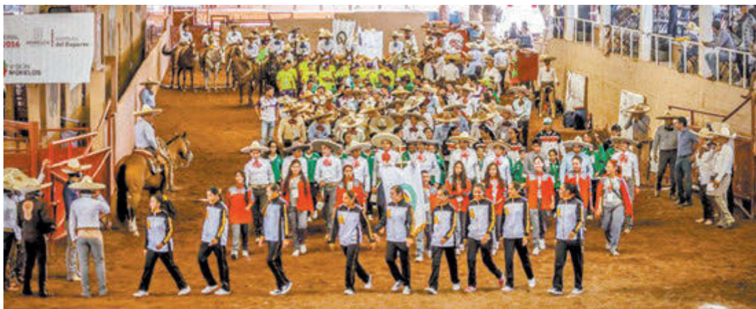
El desfile de las delegaciones del deporte federado

con 230 y Nuevo León con 224. En la Infantil B, el primer lugar lo tiene la selección de Morelos con una calificación que rebasa la barrera de la excelencia al anotarse 343 puntos, seguidos