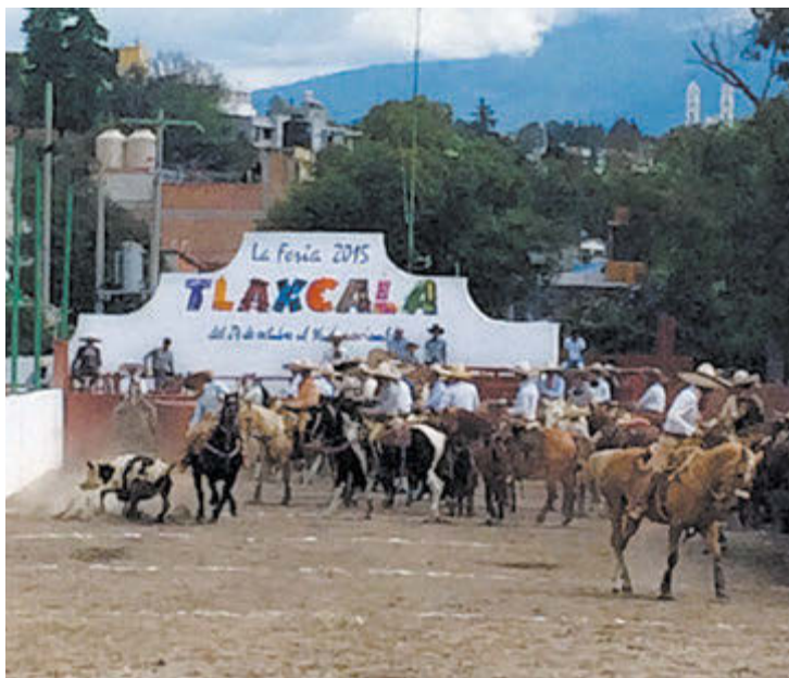
Suertes charras en la feria de Tlaxcala

Por segundo año consecutivo, el escuadrón Valle de Anáhuac, integrado por jóvenes aficionados, aplicó la misma receta, imponiéndose ampliamente a los demás equipos contendientes, donde algunos son integrados por charros pagados o profesionales, que se dedican al ciento por ciento a esta disciplina, pero con todo y eso Valle de Anáhuac cerró la etapa eliminatoria con 352 puntos, seguido de Rancho La Joya con 342; La Rincón Gallardo Rojo, 335; Charros del Peñón, 333; Pedregal 2, 331; Pedregal 1, 303; Metropolitana Rojo, 288 y Dorados de Villa, 288. Estos son los equipos que se encuentran en la antesala de la etapa de semifinales, que se llevará a cabo el próximo 14 de mayo, de