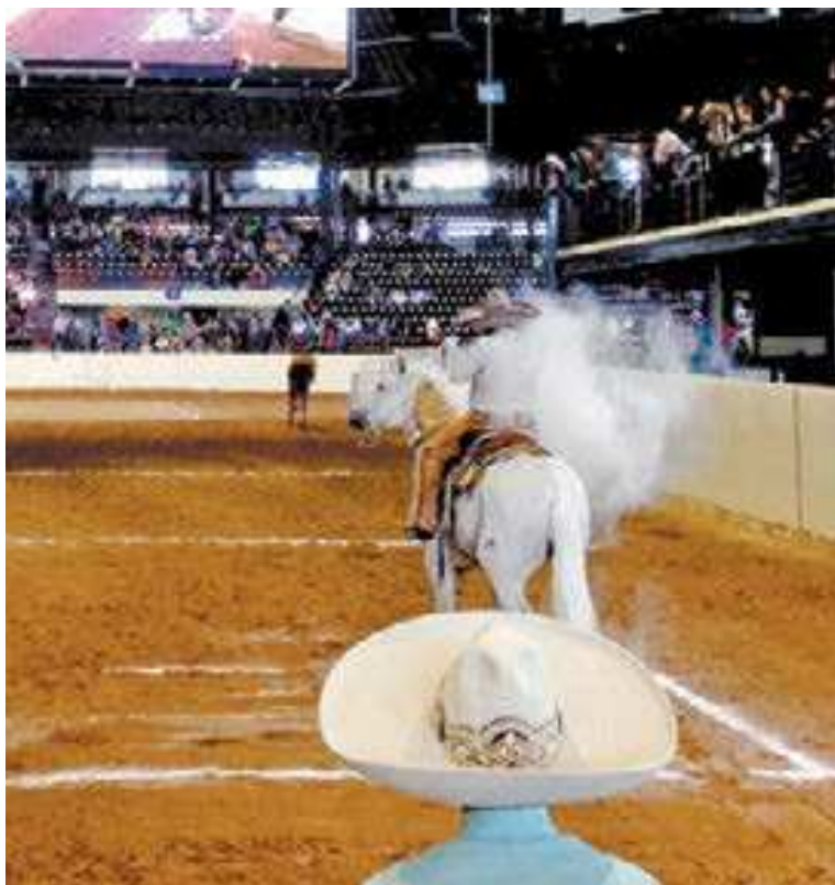
Los piales son oro en los triunfos