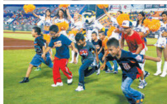
En Reynosa se regalaron juguetes; Tigres realizó concursos y en el parque Sultán hubo una fiesta acuática