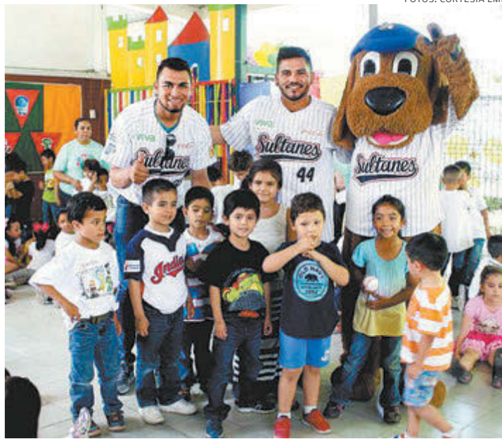
En Yucatán hubo inflables, en el parque Beto Ávila de Cancún, piñatas, y Sultanes visitó una escuela