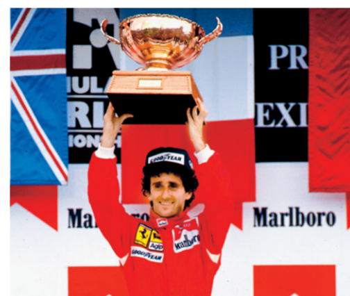
El francés Alain Prost, otra estrella que ganó en el Hermanos Rodríguez