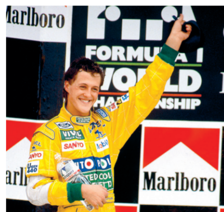
El alemán Michael Schumacher logró su primer podio en F1 en México 1992